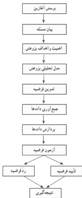
شکل ۲- مراحل یک پژوهش علمی جغرافیایی