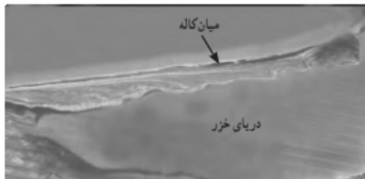
زبانه ماسه‌ای - شبه جزیره میان کاله در جنوب شرقی دریای خزر

اشکال فرسایشی تراکمی (ناشی از رسوب‌گذاری مواد) پدید می‌آیند. آب سنگ‌ها و جزایر مرجانی، باتلاق‌ها و زبانه یا دماغه ماسه‌ای از جمله این اشکال هستند. در جنوب شرقی دریای خزر شبه جزیره میان کاله زبانه ماسه‌ای وجود دارد.